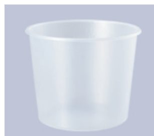
丸ソ化成 Uカート(内容器)