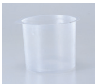
ビックさげ缶カバー