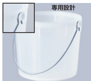
丸ソ化成 ポリ缶 小