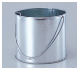
ブリキさげ缶 (外缶)